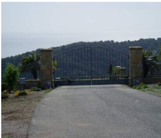
当地所へ続くゲート