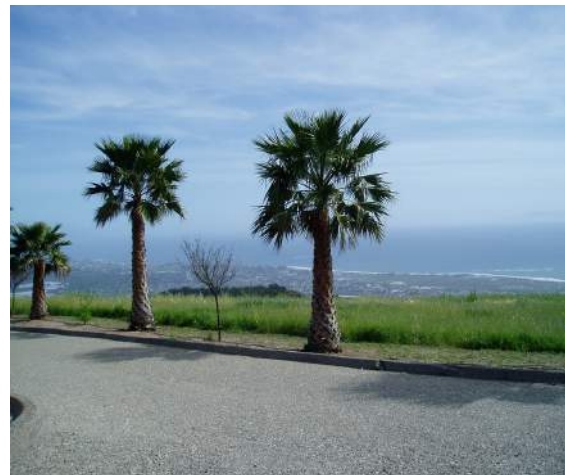
当地所へ続く私設車道