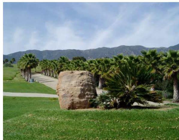
当地所へ続く私設車道