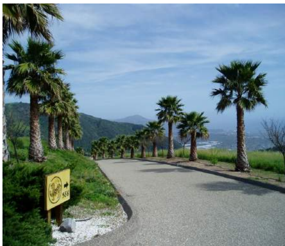
当地所へ続く私設車道